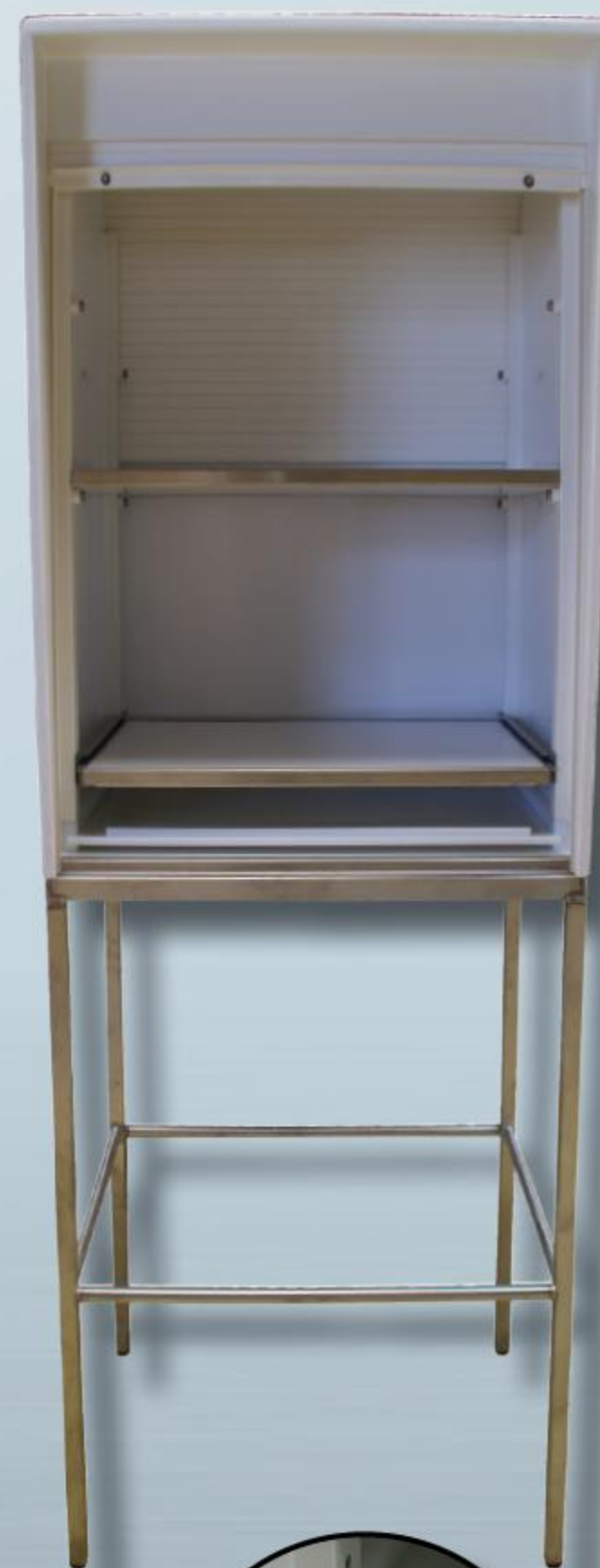
Butée en Z

Existe en Grand Modèle : AGRO GM et en version INOX