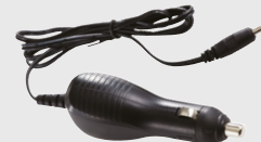
Adaptateur pour allume-cigare Permet de recharger l'imprimante dans un véhicule.