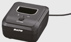
Chargeur de batterie 1 voie Recharge une batterie intelligente en 3 heures.

Il suffit de brancher l'adaptateur secteur dans l'imprimante pour effectuer la recharge entre deux utilisations. L'imprimante reste fonctionnelle pendant la recharge.