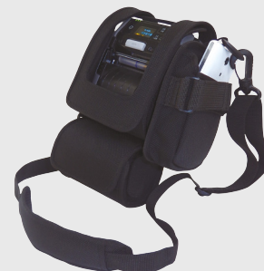
Étuis de transport

Des bandoulières sont disponibles en option comme solution mains libres.