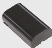
Batterie lithium-ion Modes programmables de gestion intelligente de l'alimentation et de veille pour prolonger l'autonomie de la batterie.